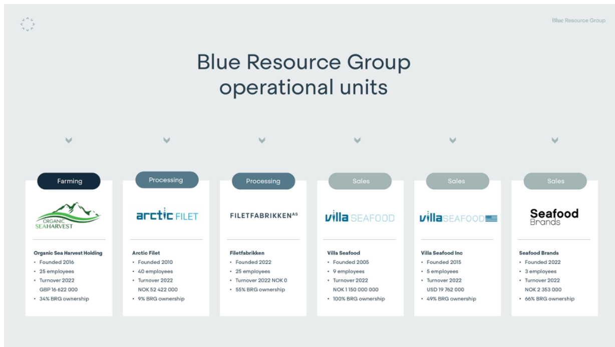
Figur 1: Blue Resource Group sin organisering per 30. juni 2023